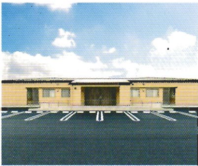
グループホーム上豊田