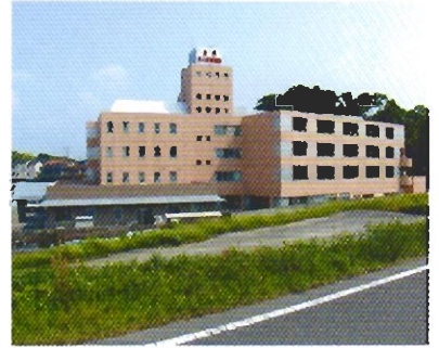
豊田老人保健施設