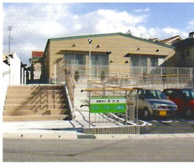
グループホーム藤岡