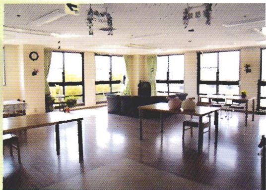
レクリエーション・談話室

振興住宅地であり、急速な発展を遂げている三好ヶ丘の北部に位置し、施設北側にはトヨタスポーツセンターがあり、また三好ヶ丘駅に近く施設のまわりも近い将来開発される予定のある大変すばらしい場所にあります。こうした環境を背景に、皆様に充実したリハビリ、暖かい看護・介護による手厚いサービスの提供をし、一日も早い自立・家庭復帰されることを目標にお手伝いしてゆきたいと考えております。